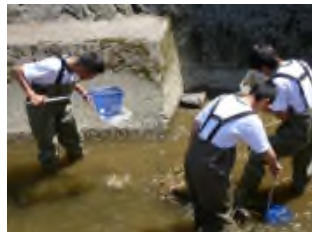
生物班での活動の様子

2年生の教養理学科と、普通科理系の生徒が行っている授業、SITPでの課題研究が始まっています。今年は物理・化学・生物・数学・情報・美術・看護の分野にわかれ、研究を行っています。それぞれの研究テーマについては海高祭でポスター発表を行います。研究結果だけでなく、発表の仕方や展示についても工夫するので、発表を楽しみにして下さい。今年の研究内容については、今後紹介していきます。