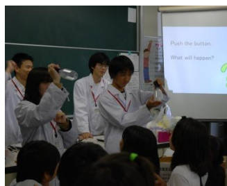
昨年度のSSI活動の様子

SSI活動では事前に実施する実験に必要な道具・材料の準備などを行い、さらに話す内容や順番などを練習してから臨みます。そして、本番では子ども達の反応を直に見ることができません。もし、先生を目指しているのならば一度参加を考えてみてください。また、昨年度からの新しい試みとして英語での授業も行っています。