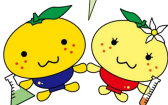
カイクン ナンちゃん

まず、SSHとは「スーパーサイエンスハイスクール」の略称で、未来を担う科学技術系人材の育成を目標に、文部科学省から指定を受けて行われている取り組みです。海南高校は平成十六年にSSHの指定を受け、今年で十一年目になります。その中で、教養理学科、普通科の希望者、科学部の先輩達が様々な研究や行事に取り組んできました。また、左のイラストは海南高校のSSHキャラクターの「カイクン」と「ナンちゃん」で、みかんと黒江漆器がモチーフとなっています。