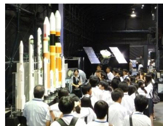
昨年度の関東研修の様子

海南高校のSSH活動ではこれら以外にも、「特別講演」や「特別講義」も行われています。昨年までのSSH活動について、もっと詳しく知りたいという方は過去の活動をまとめた「課題研究発表要約集」や、「研究開発実施報告書」が図書館に置かれていますので、ぜひ手に取って読んでみてください。皆さんの参加お待ちしております。