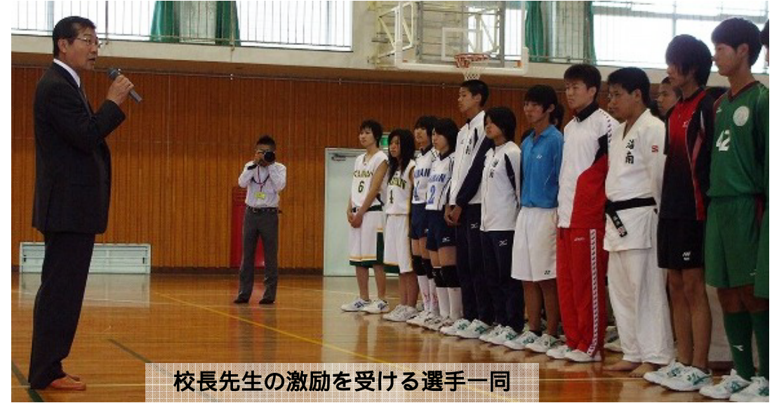
校長先生の激励を受ける選手一同

選手たちは、校長先生と生徒会長の温かい激励の言葉や応援してくれる生徒の皆さんの熱い視線を受け、試合に向けて気を引き締め直してくれたことと思います。